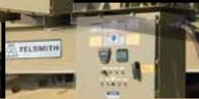
Los paneles de control se separan para la operación