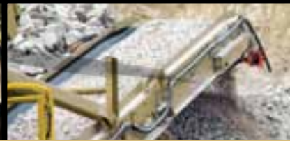
Transportador de alta producción con limpiador de banda