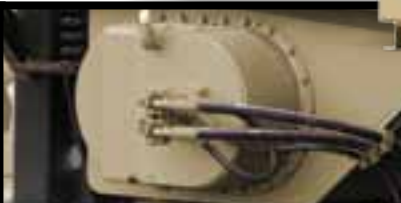
Unidade do alimentador com velocidade variável (sem correias V)