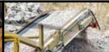
Correia transportadora de alta produção com limpador de correia