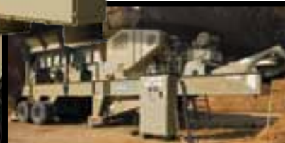
Painéis de controle desmontados para operação