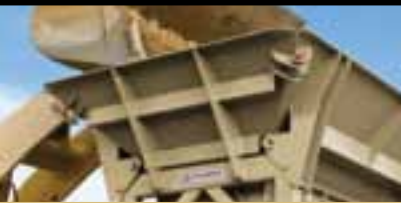
Емкость загрузочного бункера 8,0 м³ (10,5 куб. ярдов)