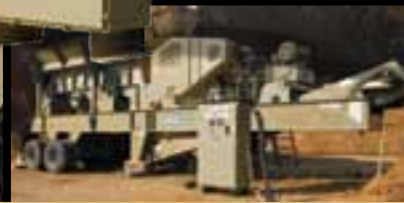
Панели управления снимаются во время эксплуатации