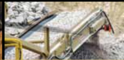
Высокопроизводительный конвейер с очистителем ленты