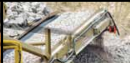
Transportador de alta producción con limpiador de banda