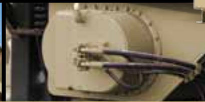
Alimentador con accionamiento de velocidad variable (sin correas en V)