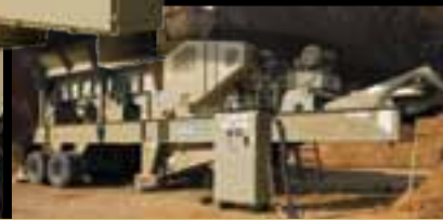
Los paneles de control se separan para la operación