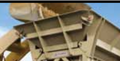
Емкость загрузочного бункера 7,25 м³ (9,5 куб. ярдов)