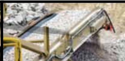
Высокопроизводительный конвейер с очистителем ленты