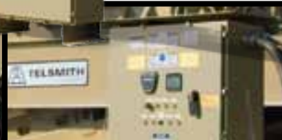
Панели управления снимаются во время эксплуатации